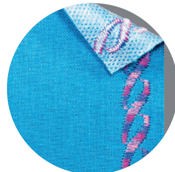
带有自黏固定层的刺绣