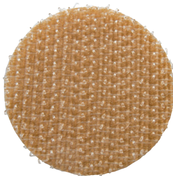
背面有黏贴的魔术贴