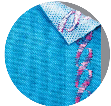
Broderie avec voile adhésif

Vous trouverez de plus amples informations sur les aiguilles pour travaux domestiques ici :