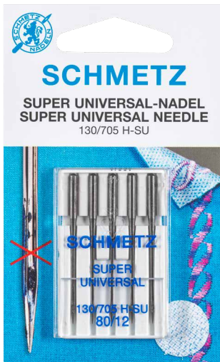
Emballage de l'aiguille

Si vous utilisez du voile auto-adhésif et de la colle en aérosol ou voulez coudre une bande scratch, vous êtes familiarisé-e avec les résidus de colle disgracieux sur l'aiguille. Les points manquants et les ruptures de fil qui en résultent sont irritants et peuvent être évités.