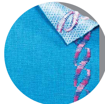
Bordado con entretela adhesiva

Para más información sobre agujas de uso doméstico, visite: