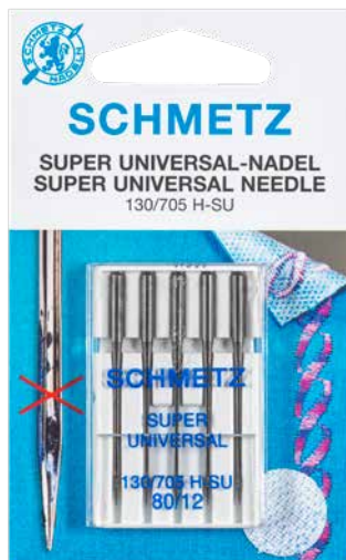
Embalaje de la aguja

Quien utiliza entretela y adhesivo temporal en aerosol o velcro autoadhesivo, en la mayoría de los casos, conoce los desagradables restos de adhesivo en la aguja. Los resultantes saltos de puntadas e hilos rotos son molestos y pueden evitarse.