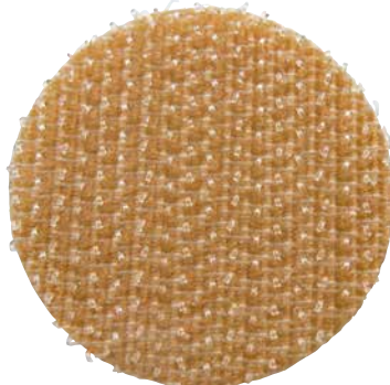
Cierre autoadhesivo de velcro