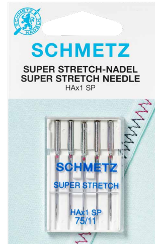
Emballage de l'aiguille

L'aiguille Super Stretch peut être utilisée sur toutes les machines à coudre familiales nécessitant le système d'aiguilles 130/705 H, ainsi que sur certaines machines Overlock (consultez le mode d'emploi pour plus d'informations). En raison de ses propriétés, la HAx1 SP offre une alternative à l'aiguille Stretch pour la couture avec des fils plus épais.