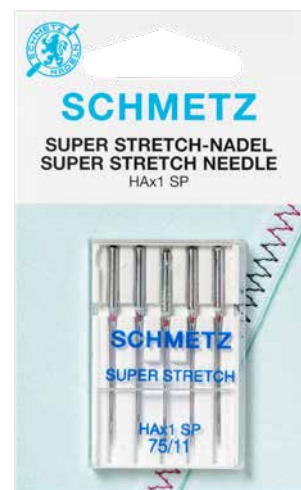
Embalaje de la aguja

La aguja Super Stretch puede utilizarse en todas las máquinas de coser domésticas que requieren el sistema de agujas 130/705 H, así como en algunas máquinas Overlock (encontrará informaciones al respecto en su manual de instrucciones). Gracias a sus propiedades, HAx1 SP es una alternativa a la aguja Stretch al coser con hilos más gruesos.